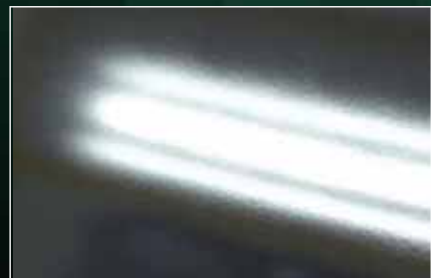
COLORSTAGE ® ノンサンディング仕様