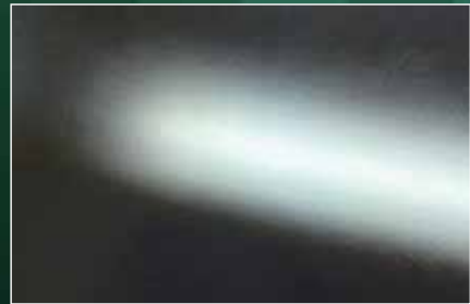
A社 相当品 (非環境配慮型塗料) ノンサンディング仕様